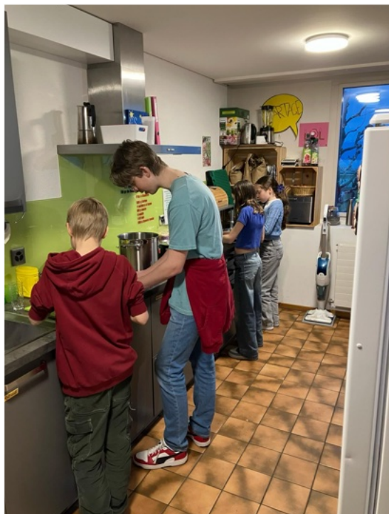
Espace de partage, de joie et de collaboration, la cuisine du CDJ est un lieu rassembleur et emblématique!